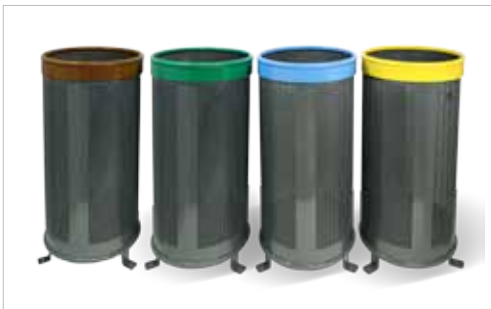
PA620M - PA620V - PA620AZ - PA620A

Variantes / Variantes / Alternatives / Variações